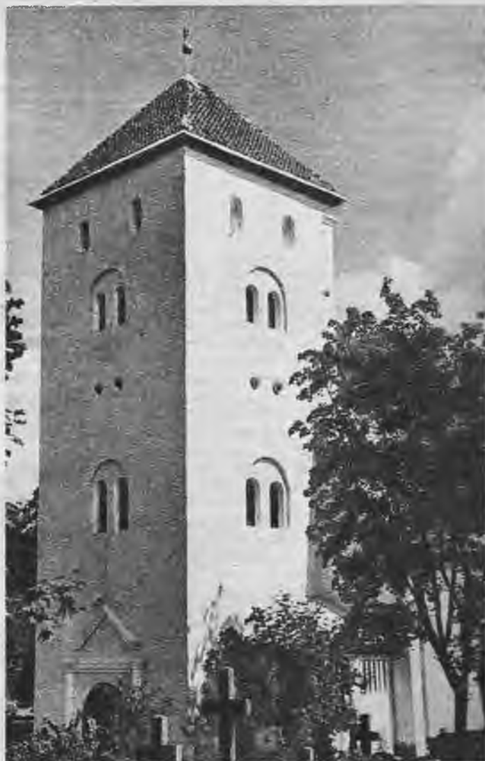
1614. g. celtā Tērvetes baznīca.