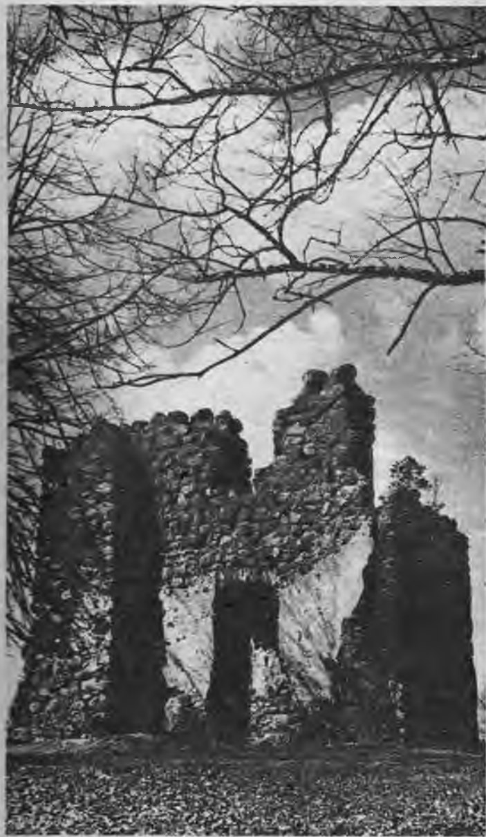
Herogu laikā celtās pils drupas.