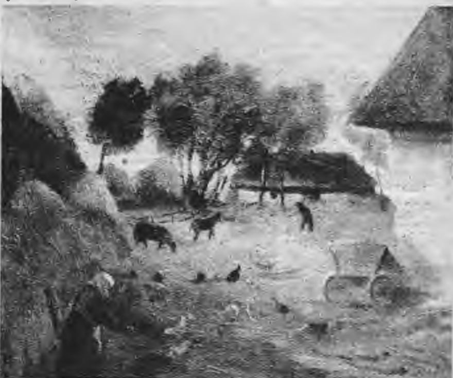
N. Drapče — Zvejniekciems