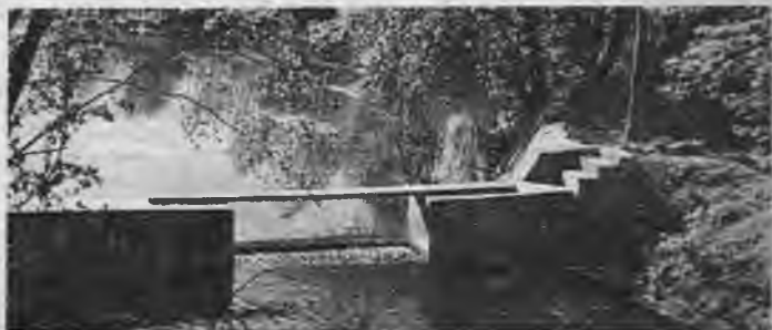
Romantisks stūrītis sanatorijas tuvumā.