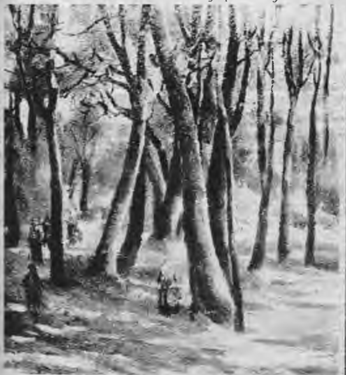
N. Drapče — Parkā.