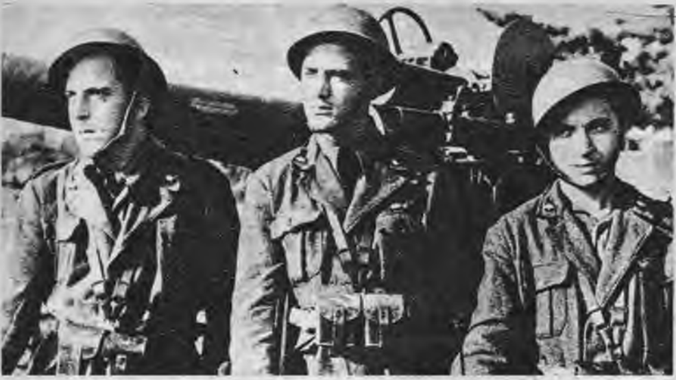
PK-kara ziņotāja Kiršes. (Vb) uzp.