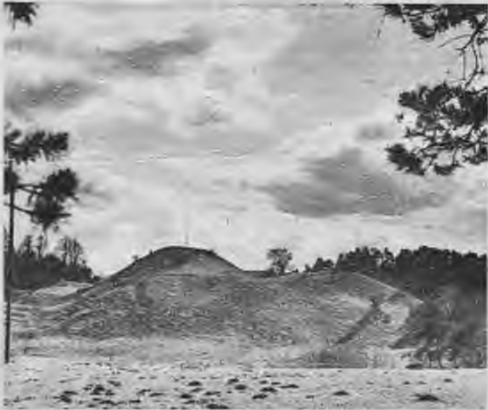
Gleznainais Viestura pilskalns.